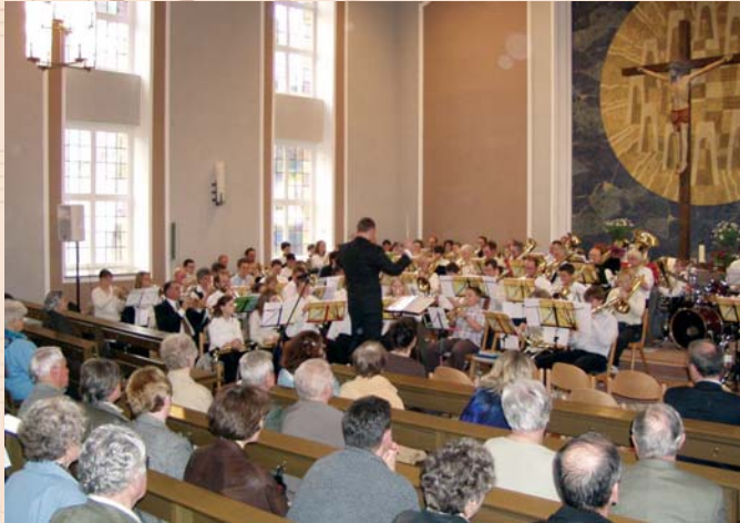
... im Gottesdienst