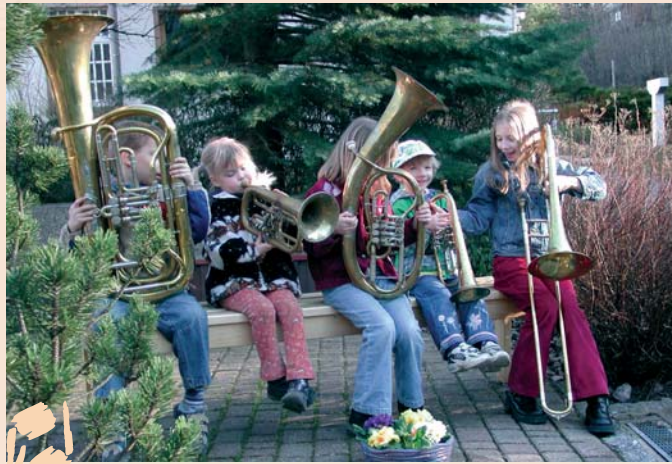
... schon interessiert!

Durch vielseitige Schulungsangebote in den einzelnen Chören, auf regionaler wie auf Bundesebene werden Bläserinnen und Bläsern weiterführende musikalische und geistliche Impulse für ihre Chorarbeit vermittelt. Sie lernen neue Literatur kennen, üben das Ensemblespiel und erhalten Korrektur in Blastechnik, Artikulation und Interpretation.