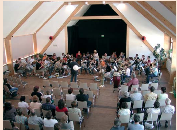
... im Konzert

Der „bcpd“ ist ein Zusammenschluss von Posaunenchören evangelischer Freikirchen in Deutschland und wurde als Verein 1909 in Siegen gegründet. Er besteht aus acht Regionalverbänden mit ca. 2.100 Bläserinnen und Bläsern, die verschiedenen Freikirchen angehören: