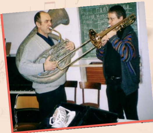
Zusammenarbeit mit ausländischen Partnerkirchen (Weißrussland und Serbien)

Der bcpd ist Mitglied im Evangelischen Posaunendienst in Deutschland e.V.